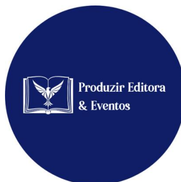
Figura 1: legenda (exemplo: logomarca da Produzir Editora & Eventos).

Tabelas, quadros e figuras: os títulos de qualquer tipo de ilustração (desenho, esquema, fluxograma, fotografia, gráfico, mapa, organograma, planta, quadro, retrato, figura, imagem, entre outros) devem aparecer na parte superior das mesmas. Esses objetos, bem como título e fonte devem ser centralizados. Os títulos e as fontes devem utilizar fonte Times New Roman, tamanho 10. As fontes das figuras devem conter o endereço online ou se foram adaptadas ou de autoria própria (Exemplo: Figura 1).